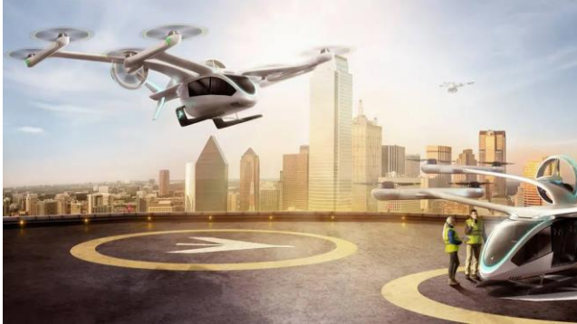
Modelo de eVTOL apresentado pela Embraer em 2019