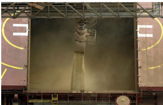
Navio carregado com soja no porto de Paranaguá (PR)

SÃO PAULO (Reuters) – As exportações brasileiras de soja alcançaram 16,4 milhões de toneladas em maio, alta de 16,3% em relação ao mesmo período de 2020, mostraram dados divulgados pela Secretaria de Comércio Exterior (Secex) nesta terça-feira.