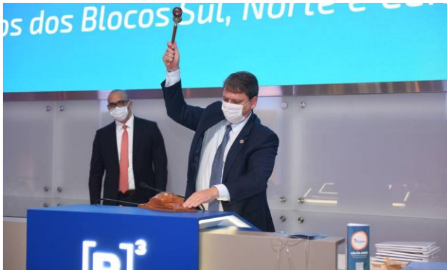
Ministro da Infraestrutura, Tarcísio Gomes de Freitas, participa de leilão de aeroportos

BRASÍLIA - Em palestra dirigida a investidores nacionais e estrangeiros que acompanham os debates no Brasil Investment Forum, o ministro da Infraestrutura, Tarcísio Gomes de Freitas, afirmou que os contratos no país são sempre respeitados, independentemente da ideologia ou de movimentos políticos. Ele citou como exemplo a rodovia Presidente Dutra, que liga o Rio a São